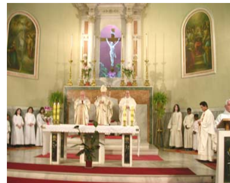
Centrale et Occidentale, leur cathédrale depuis 1970.